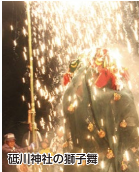
砥川神社の獅子舞