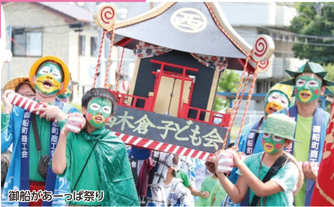
御船があーっぱ祭り

今年4月から10月にかけて郡内5町で行われる予定の催し物を紹介します。なお、新型コロナウイルス等の影響により、中止または延期になる場合がありますので、事前に各町にお問い合わせください。