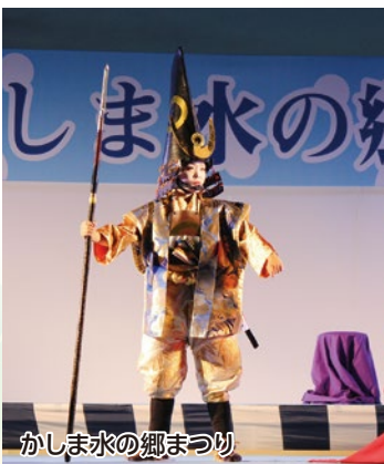
かしま水の郷まつり