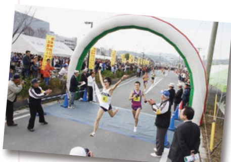
10マイルロードレース【甲佐町】