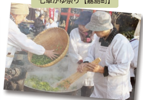
七草がゆ祭り【嘉島町】