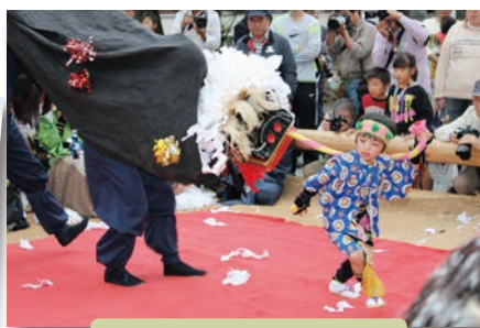
六嘉宮大祭【嘉島町】