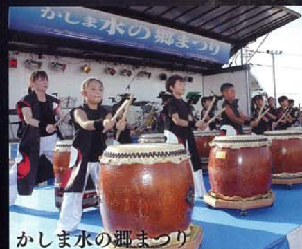
かしま水の郷まつり