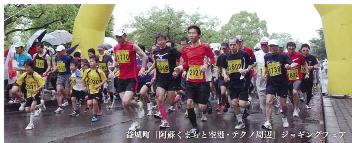
益城町「阿蘇くまもと空港・テクノ周辺」ジョギングフェア