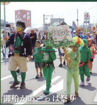
御船があーっぱ祭り