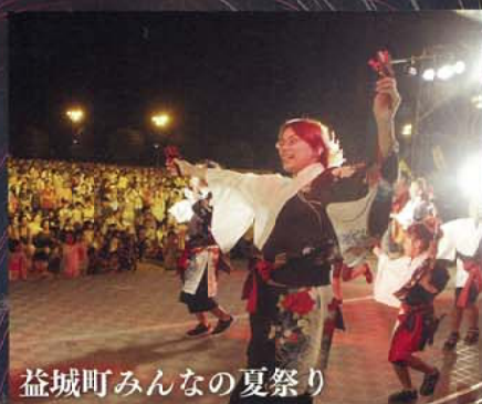
益城町みんなの夏祭り

益城町の魅力ある産品を集めた物産販売会です。新鮮野菜や、惣菜、お菓子、飲み物、軽食、雑貨まで幅広く取り揃えています。安心安全な対面販売で行いますので、ぜひご来場ください。