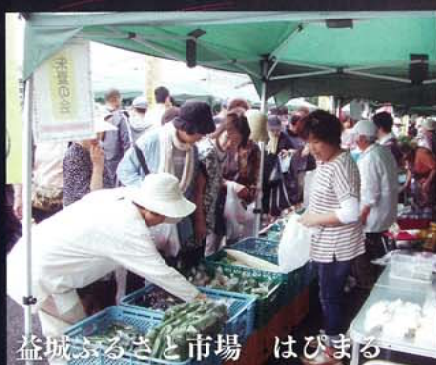
益城ふるさと市場 はびまる