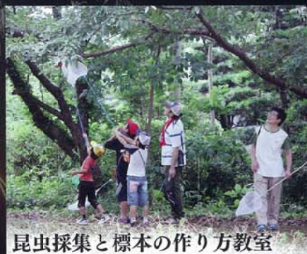
昆虫採集と標本の作り方教室

県の重要無形文化財に指定されている六嘉宮社の例祭。加藤清正の虎退治に由来し、勇壮な獅子舞や高さ20メートルの梯子から牡丹が舞う「タナ登り」など見どころ満載です。