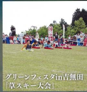
グリーンフェスタin吉無田「草スキー大会」

熊本県下でも三大精霊流しに数えられる御船町の精霊流し。御船川で行われ数百の供養万灯が川面を彩り精霊船が流されます。