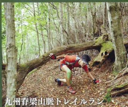
九州脊梁山脈トレイルラン