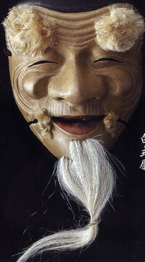
はくしきじょう 白式尉