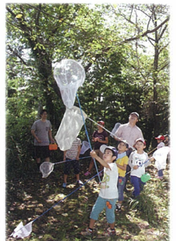
昆虫採集と標本の作り方教室

虫取り網とカゴを持って上島四所神社周辺でゼミヤチョウなどの昆虫採集。その後、採集した昆虫の標本作りの実践指導があります。