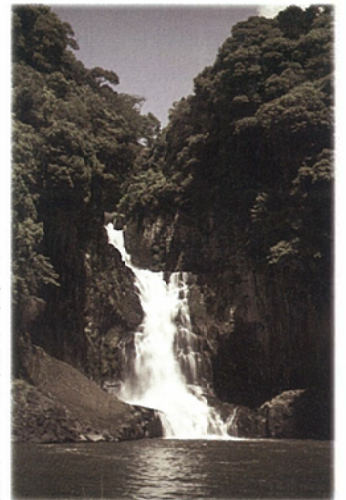
御船町七滝地区 七滝