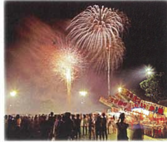
益城町みんなの夏祭り

期日：毎月第3日曜日(予定) 場所：益城町保健福祉センター はびねす駐車場 益城町の魅力ある産品を集めた物産販売会です。新鮮野菜や惣菜、お菓子、飲み物、軽食、雑貨まで幅広く取り揃えています。安心安全な対面販売で行いますので、ぜひご来場ください。