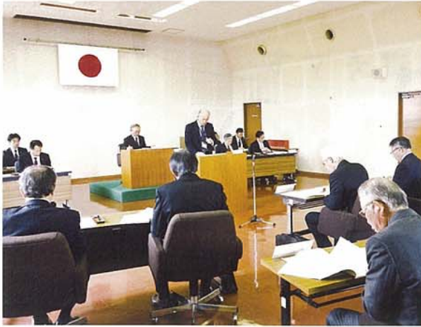
上益城広域連合議会当日の様子。郡内5町の町長及び代表議員で構成された本議会では多岐にわたって活発な議論が行われています。

平成28年度上益城広域連合一般会計予算について （歳入・歳出予算総額は、それぞれ6,847万円。詳細については3ページをご覧ください）