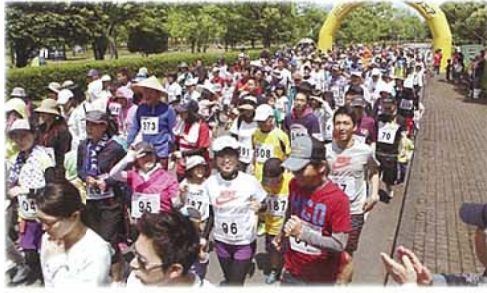
ジョギングフェア

「第24回益城町「阿蘇くまもと空港・テクノ周辺」ジョギングフェア」 期日：5月15日(日) 場所：テクノリサーチパーク 新緑のテクノ公園をてくてく走ろうをキャッチフレーズに開催し、毎年1,700人もの参加者で賑わっています。3キロ、5キロコースがあり、子どもから大人まで楽しめる大会です。参加賞はスイカやメロンなどの特産物を用意しています。また、アトラクションや抽選会も行われます。