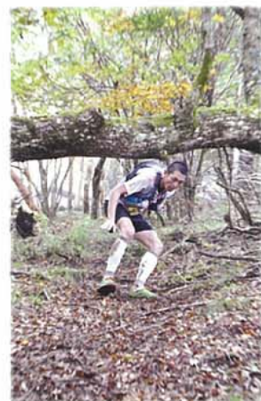
九州脊梁山脈トレイルラン

「新茶まつり」 期日：5月下旬 場所：道の駅 「通潤橋」前 町内で採れた新茶の心地よい香りに包み込まれるイベントです。昨年は新茶の販売を始め、新茶を使用した釜炒りや手もみ体験のほか、矢部高校茶道部による、お茶の振る舞いなど数多くのイベントが催されました。 「火伏地蔵祭」 期日：8月20日(土) 場所：馬見原 商店街一帯 450年から続くといわれる歴史ある祭り。日用品を用いて作成された造り物が展示されるほか、勇壮な裸みこしが商店街の中を駆け巡ります。 「八朔祭」 期日：9月上旬 場所：浜町商店街 一帯 山野の植物などを用いて、趣向を凝らして造られる「大造り物」の引き廻しで知られる八朔祭り。八朔(旧暦8月1日)の日に豊年祈願と商売繁盛を願い開催されます。 「九州脊梁山脈トレイルラン」 期日：10月上旬 場所：九州脊梁一帯 清流館↓小川岳・向坂山・三方山↓清流館の登山道コースを走り順位を競う競技。フルマソンを5時間以内で完走する身体能力を有する方を対象としている山の鉄人レースです。 「文楽の里まつり」 期日：9月中旬 場所：道の駅 「清和文楽邑」周辺 山都町清和地区の秋の収穫祭。県の重要無形文化財「清和文楽」の特別公演をはじめ、農産物の展示即売会や各種バザーなどが行われます。